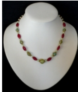
AC 082 Colliers simples Perles de Murano anciennes