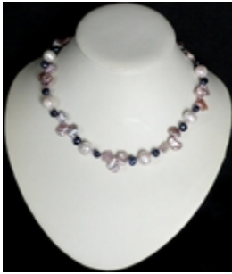
AC 028 Colliers simples Perles d'eau douce