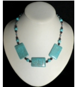
AC 016 Colliers simples Perles de verre, pierre