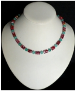
AC 062 Colliers simples Perles de verre