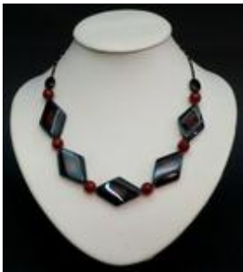
AC 004 Colliers simples Pierres naturelles