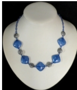
AC 025 Colliers simples Perles de verre