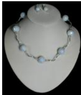
AC 030 avec boucles d'oreilles Colliers simples