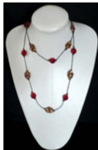
AS 006 Colliers doubles Perles de verre