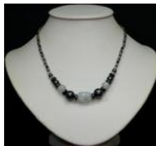
AC 037 Colliers simples Perles de verre, hématite