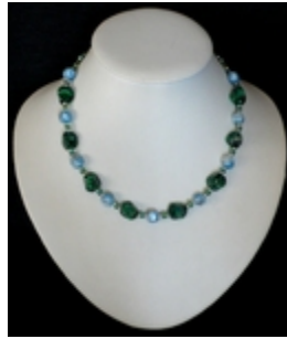
AC 079 Colliers simples Perles de Murano anciennes