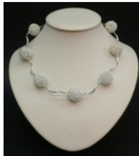
AC 001 Colliers simples Perles de métal