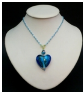
AP 004 Colliers pendentifs Verre