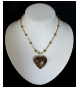
AP001 Colliers pendentifs Verre