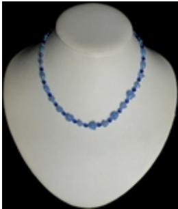
AC 023a Colliers simples Perles de Murano anciennes