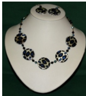
AC 003a avec boucles d'oreilles Colliers simples