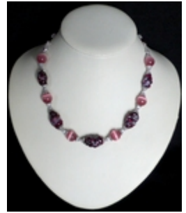
AC 029d Colliers simples Perles de Murano anciennes et oeil de chat