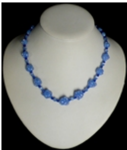
AC 023 Colliers simples Perles de Murano anciennes