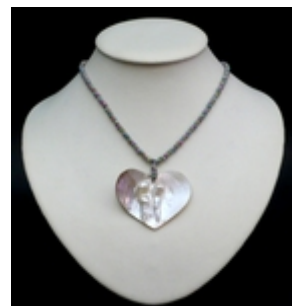
AP 008 Colliers pendentifs Coquillages