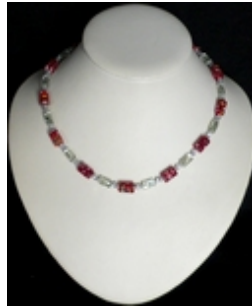
AC 056 Colliers simples Perles de verre