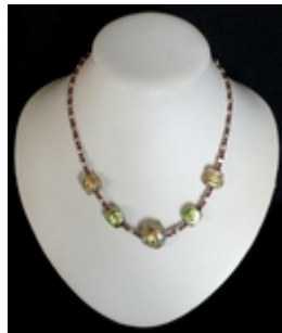
AC 083 Colliers simples Perles de Murano anciennes