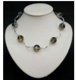
AC 052 Colliers simples Perles de verre taillées