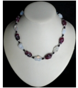
AC 029c Colliers simples Perles de Murano anciennes