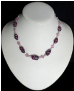
AC 029b Colliers simples Perles de Murano anciennes et perles de verre