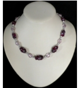
AC 029a Colliers simples perles de Murano anciennes et oeil de chat