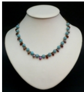
AC 014 Colliers simples Perles de verre