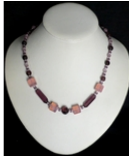
AC 085 Colliers simples Perles de Murano anciennes, cristal taillé, verre