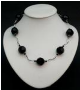
AC 057 Colliers simples Perles de verre, métal