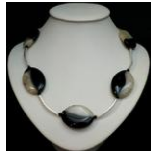
AC 043 Colliers simples Perles de verre, métal, pierres naturelles