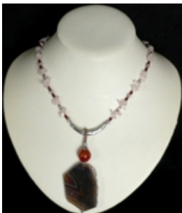
AP 022 Colliers pendentifs Pierres naturelles, métal