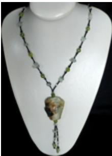
AP 007 Pendentif long Colliers pendentifs Pierres naturelles, verre