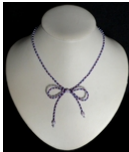
AC 071 Colliers simples Petites perles