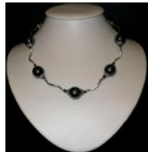
AC 036 Colliers simples perles de verre, métal