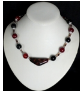
AC 060 Colliers simples Pierres naturelles, perles de verre