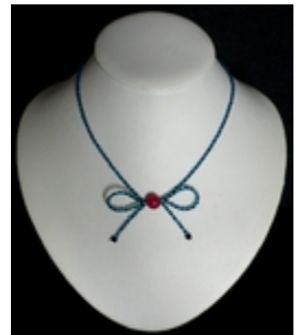
AC 069 Colliers simples Verre, grains de verre