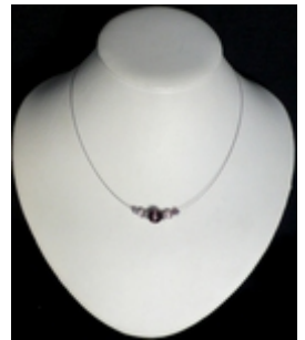
AC 039 Colliers simples Perles de verre