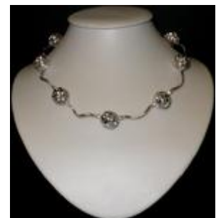
AC 034 Colliers simples Métal