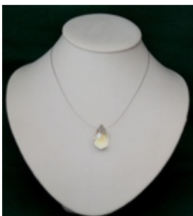
AP 023 Colliers pendentifs Cristal taillé, métal