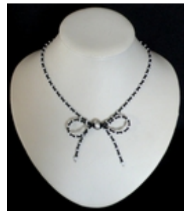
AC 073 Colliers simples Verre, grains de verre