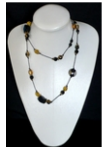
AS 005 Colliers doubles Perles de verre