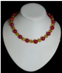
AC 063 Colliers simples Perles de verre