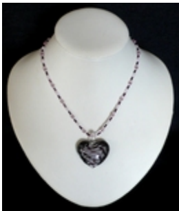
AP 012 Colliers pendentifs Verre