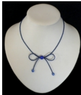
AC 072 Colliers simples Verre, grains de verre