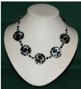
AC 003 Colliers simples Perles de nacre teintées