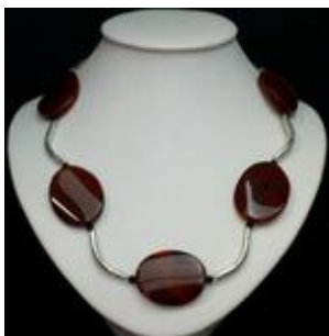
AC 042 Colliers simples Pierres naturelles, perles de verre, métal